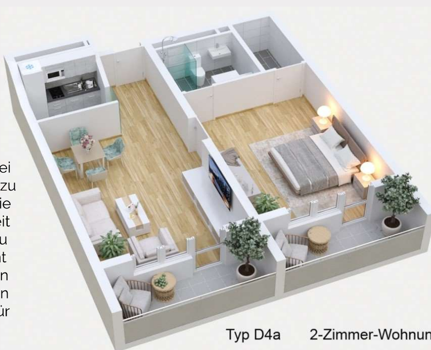
Typ D4a 2-Zimmer-Wohnung

Um die Nachfrage nach drei und vier Zimmern erfüllen zu können, bieten wir – falls sie sich ergibt – die Möglichkeit an, ein 2-Zimmer- und dazu ein 1-Zimmer-Appartement hinzu zu mieten. Oft können wir eine Lage auf derselben Etage oder sogar Tür an Tür ermöglichen.